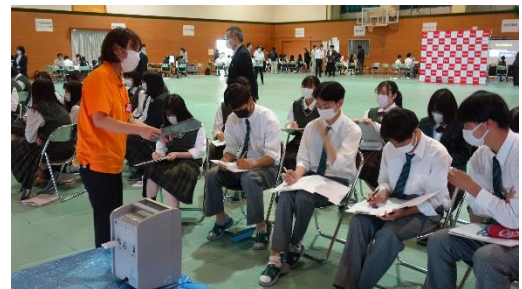
昨年度の会場の様子